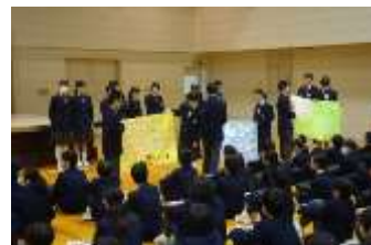
【2年生から1年生へ メッセージを送りました】