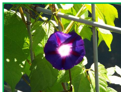
A棟前のフェンス「あさがお」