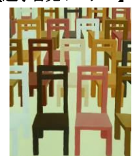
【選挙啓発ポスター】