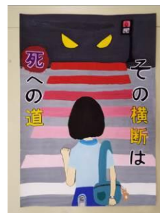
【交通安全ポスター】