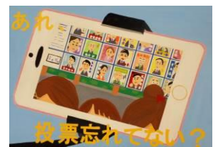
【選挙啓発ポスター】