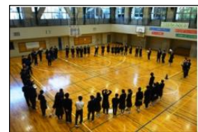
生徒会本部企画 … 他学年交流会の実施