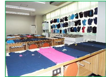
1・2年家庭「エプロン・エコバック」