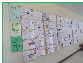
1年社会「国調べ新聞」