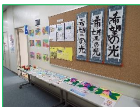
1組「平面・立体作品」

3年生は高校入試とコロナウイルスの感染拡大に不安を感じながら、進路決定するための重要な時期を迎えています。今年度実施されている都立高校入試では、志望校への出願がインターネット出願に変わり、学校では生徒のインターネット出願された内容を承認する事務手続きを行うなど、入試事務に関わる電子化が加速しています。今は私立高校推薦入試、都立高校推薦入試が終り、その結果の知らせが届いています。2月10日からは私立高校の一般入試が行われ、翌日には結果が届きます。3年生はまだ入試が続きます。最後まで健康に留意しながら、真剣に頑張って乗り切ってください。そして、受験生をもつご家族のみなさんの健康と惜しめない協力をお願いします。一方、1・2年生にとっての3学期は、逃げていくようにとても早く過ぎていきます。この一年を総括し、来年度を見据えた生活を過ごしましょう。