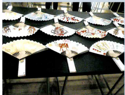
学習作品展示週間