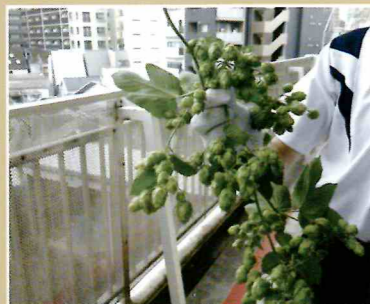
ガーデニング部(拠点校)