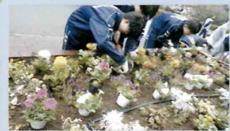
美化ボランティア