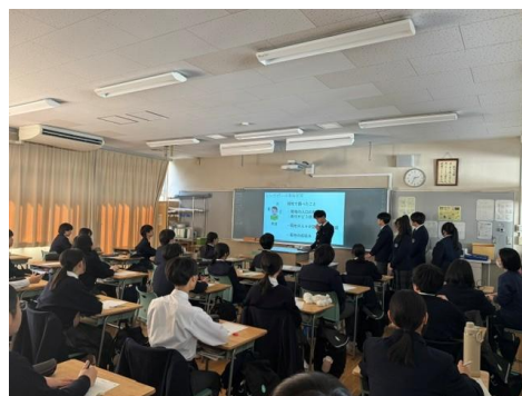
NUS 留学生との交流(左)、シンガポールについて上級生からの学びの継承(右)