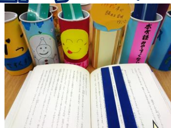
委員が作ったリーディング ルーラーも試してみてくださいね

図書委員会今年度の企画は『貸出冊数クラス対戦』です。 12月16日(月)から12月20日(金)までの貸出冊数を クラス間で競い合おうというものです。 各学年、優勝クラスには、図書委員手づくりの表彰状が授 与されます。この機会に!ばーんと!借りてください。 なお、貸出上限は3冊と説明がありましたが、冬休み前な ので5冊に変更します。